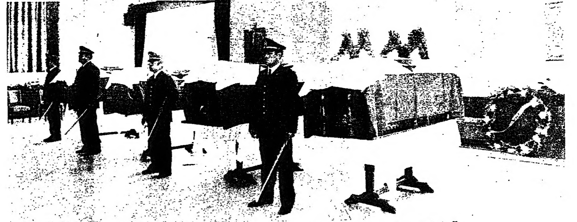
نعوس الشهداء الاربعه مسجداً في النادي العسكري بيروت بحراسه ضباط